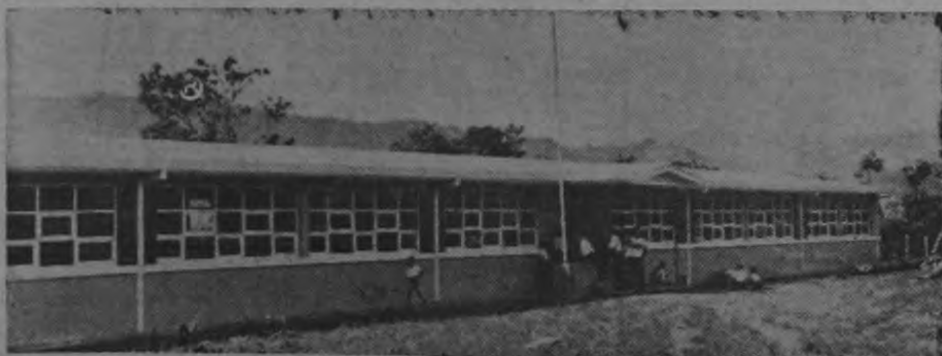
Vista de la nueva escuela en el Yas de Cartago. Fue terminada en un tiempo récord por el Ministerio de Obras Públicas. La vieja escuela, in-

creiblemente, fue quemada por un pirmano. Ayer este nuevo edificio fue oficialmente puesto en servicio. —