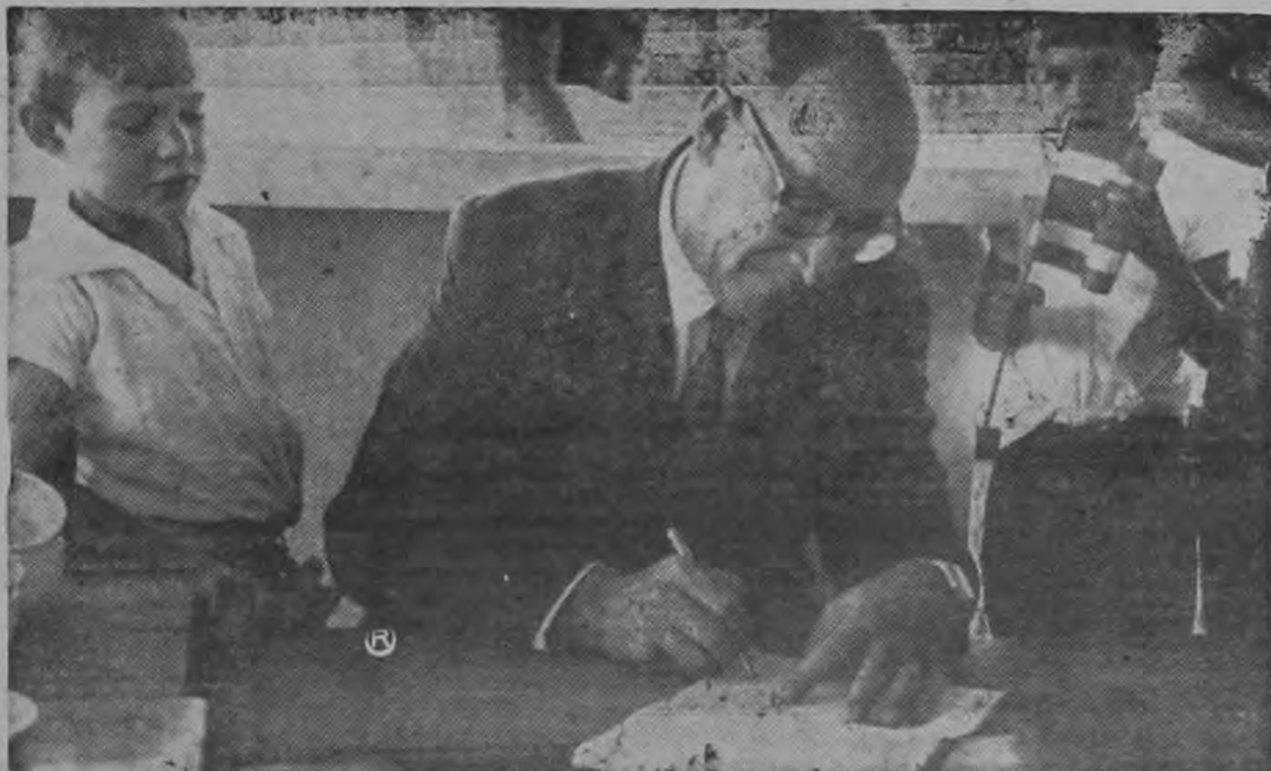
El Presidente de la República, Francisco J. Orlich, cuando firma uno de los "Cuadernos de Vida", que le llevaron los escolares de la pobla-

ción de El Yas de Paraíso. Fue un hecho muy simpático durante la inauguración de la nueva escuela de esta población.