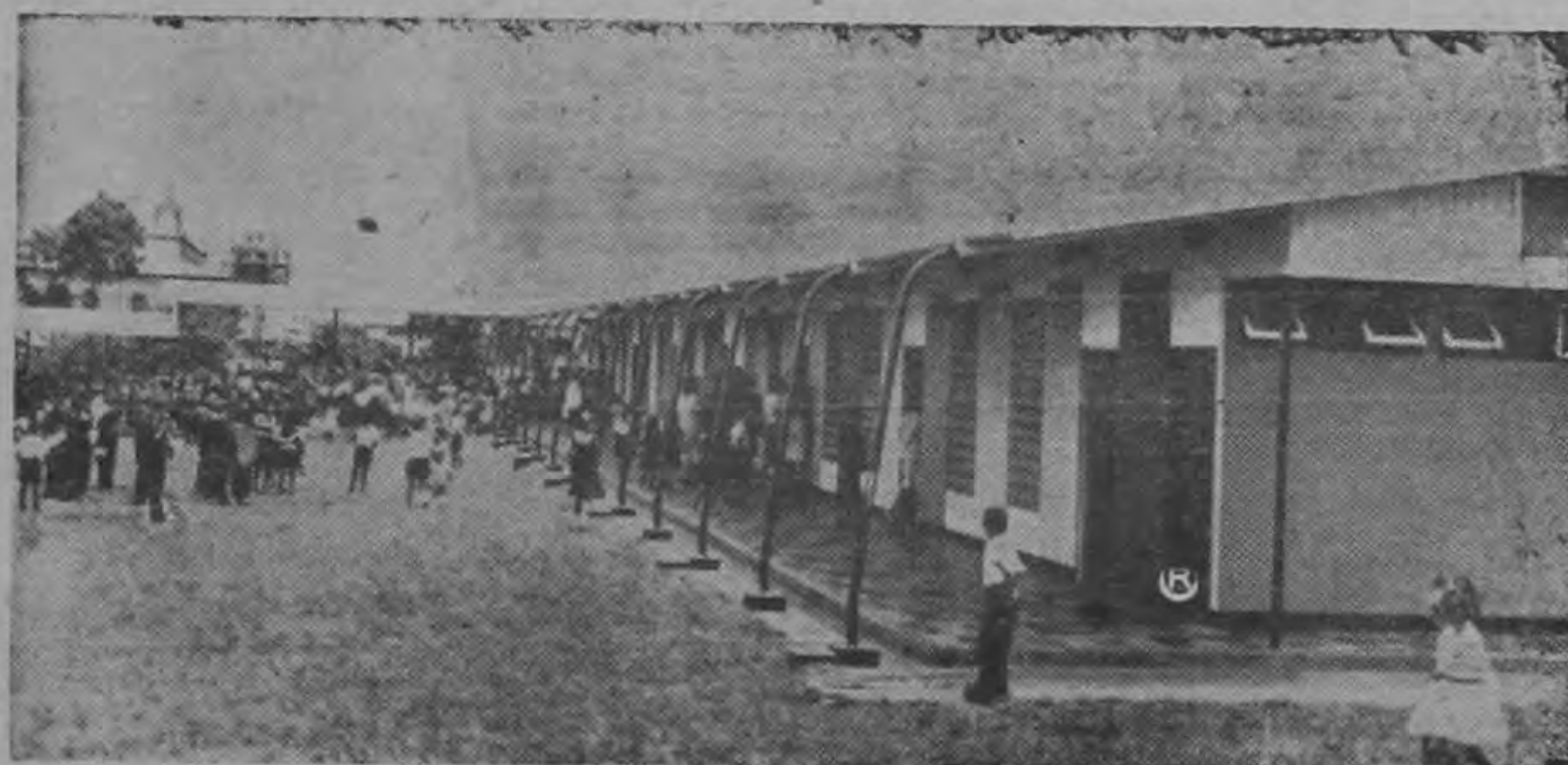
Pabellón de la nueva escuela de San Rafael de Oreamuno. Fue entregado ayer en la mañana por el Presidente de la República y el Ministro de

ción de El Yas de Paraíso. Fue un hecho muy simpático durante la inauguración de la nueva escuela de esta población.